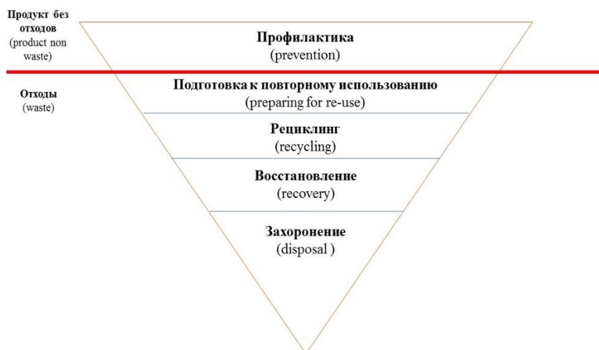
Рис. 2. Иерархия управления отходами в ЕС

Предотвращение. В литературе предотвращение образования отходов (далее «предотвращение») понимается как необходимость разработки материалов, товаров и услуг таким образом, чтобы при их производстве, использовании, повторном использовании и рециклинге, а также при удалении по завершении срока их службы образовывалось как можно меньше отходов. Директива 2008/98/ЕС определяет, что «предотвращение означает меры, которые предприняты до того, как вещество, материал или продукт становятся отходами, и которые наперед сокращают: а) количество отходов, включая повторное использование продуктов или увеличение их жизненного цикла; б) негативное воздействие произведенных отходов на окружающую среду и человеческое здоровье; в) содержание опасных субстанций в материалах и продуктах» [9].