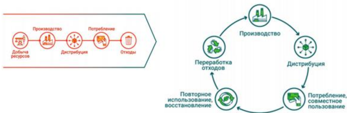
Рис. 3. Отличия моделей линейной (слева) и циркулярной экономики (справа)

циркулярной экономики» (Closing the loop – An EU action plan for the Circular Economy). Основное отличие циркулярной экономики от традиционной линейной представлено на рисунке 1.