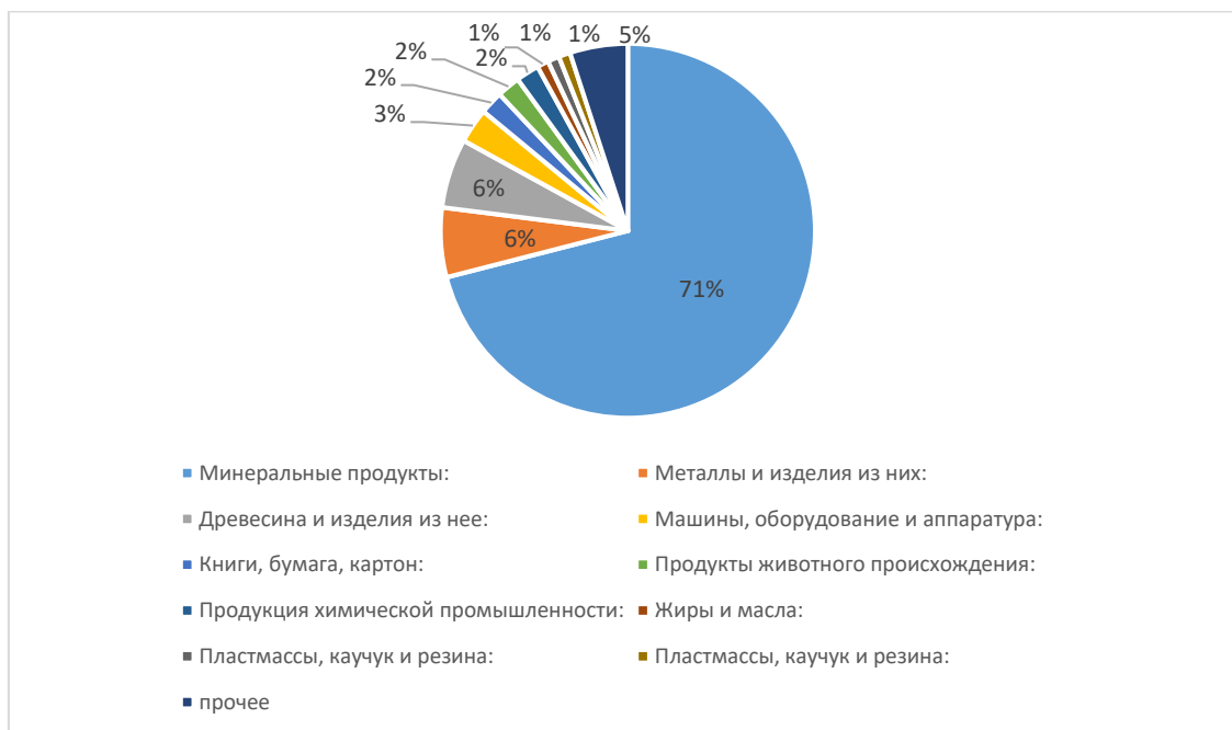
Рис 1. Структура российского экспорта в Китай.

Что же касается отдельно экспорта товаров из России в Китай, то в 2020 году в денежном выражении этот показатель составлял всего 49,1 млрд долл., что на 32% меньше, чем 64.8 млрд долл. 2021 года (рис.1.).