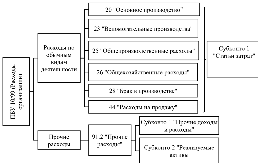
Рис. 1 Статьи затрат в бухгалтерском учете в 1С 8.3 Бухгалтерия.

Все документы 1С Бухгалтерии формируют проводки по дебету производственных счетов затрат (20, 23, 25, 26, 28, 44):