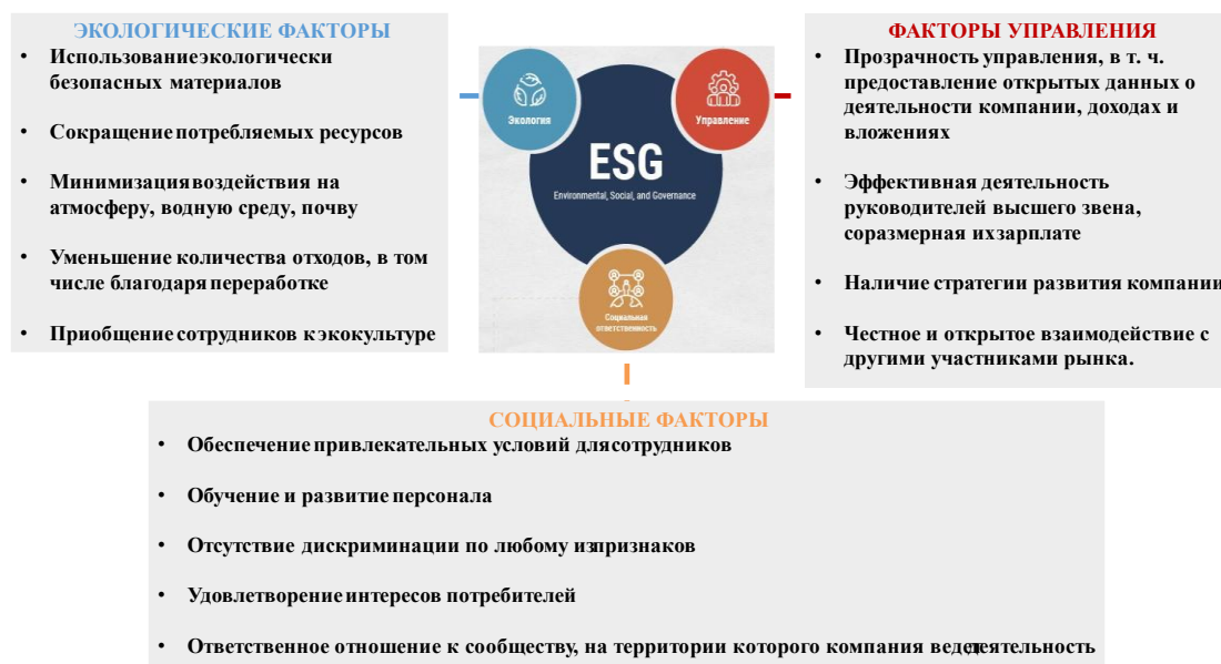
Рис. 3 Климатические обязательства стран ЕАЭС.

Данный подход включает факторы окружающей среды, социальные факторы и факторы управления (рис. 3). Экологический критерий оценивает влияние компаний на окружающую среду. Социальные факторы рассматривают отношения предприятия с сотрудниками, поставщиками, клиентами, сообществами и включают в себя условия труда, взаимоотношения с потребителями и местными сообществами, охрану здоровья и безопасность, гендерный состав. К управленческим факторам относят долгосрочную стратегию компании, аудит и внутренний контроль, состав совета директоров, вознаграждение менеджмента, права акционеров, взяточничество и коррупцию [3].