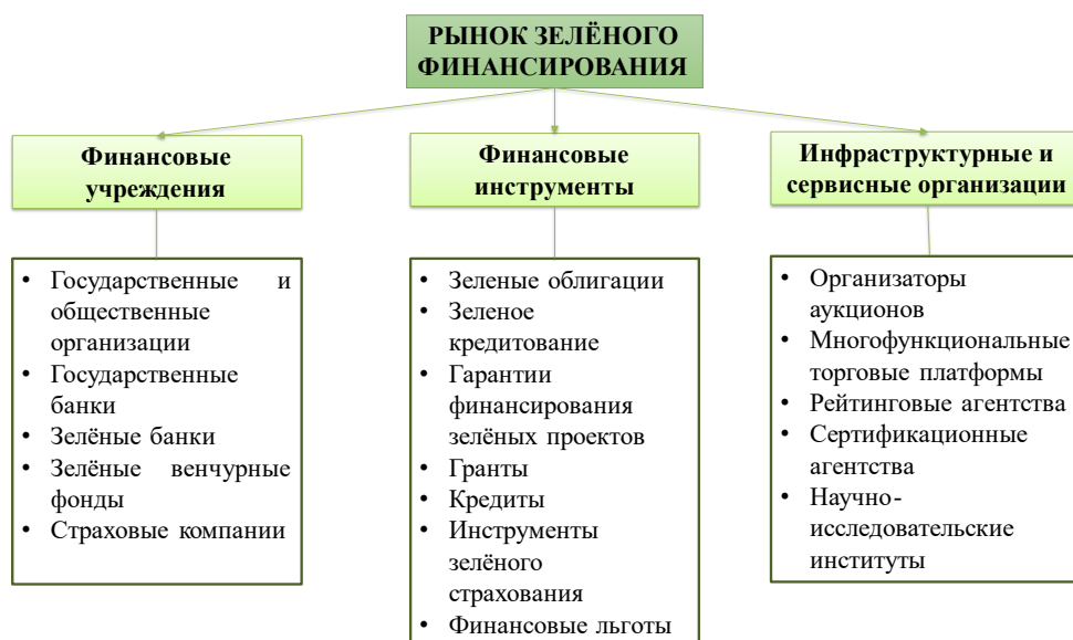
Рис. 4 Структура рынка зеленого финансирования.

В настоящее время лидирующие позиции в борьбе с изменением климата в мире занимают страны Европы. ESG-законодательство в Европе на текущий момент является самым действенным, комплексным и структурированным инструментом для совершенствования показателей E, S и G на уровне стран (табл. 1). Новые законодательные инициативы ЕС имеют большое значение для принятия и структурирования инвестиционных решений [5].