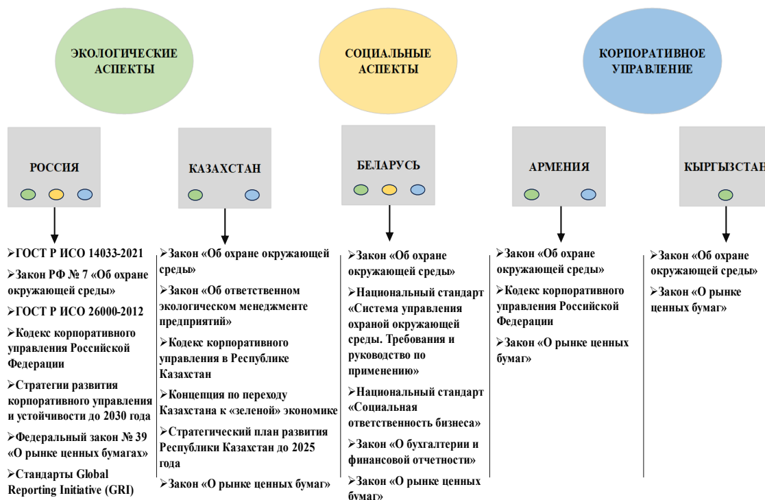
Рис. 5 Нормативная база ЕАЭС, связанная с ESG