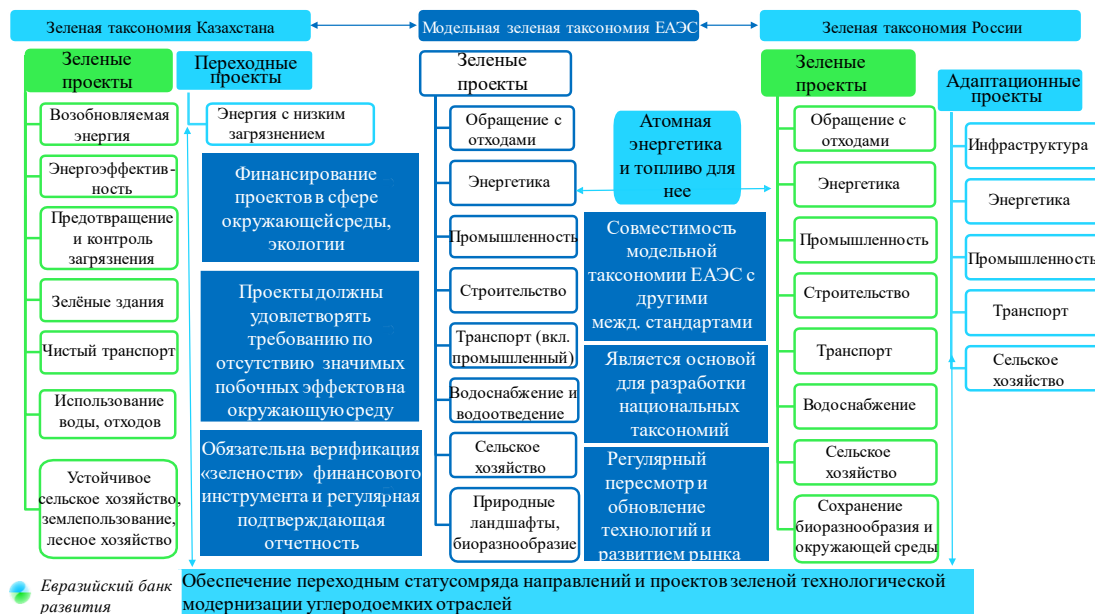
Рис. 6. Таксономии зеленых проектов Казахстана, России и ЕАЭС.

Из финансовых отчетов стран были взяты и рассчитаны объемы ESG-облигаций. Безусловным лидером в размещении «зеленых» облигаций среди стран ЕАЭС является Россия.