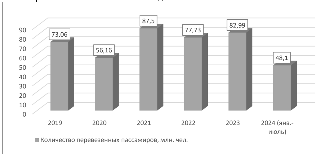
Рис. 2 Динамика пассажиропотока на внутренних рейсах в РФ, 2019-2024 гг.

Однако уже со следующего года наблюдается снижение масштабов субсидирования, которое так же учитывается в прогнозе на 2025 год. Таким образом, спрос авиакомпаний на государственную поддержку в форме субсидий постепенно снижается за счет восстановления экономики страны и увеличения пассажиропотока после 2020 и 2022 года соответственно.